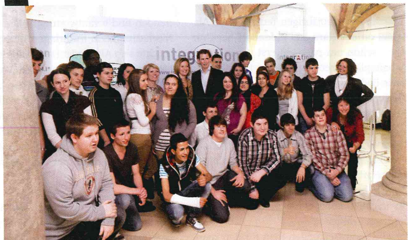
Was wünschen sich Jugendliche von der Politik? Besuch im Innenministerium bei STS Sebastian Kurz