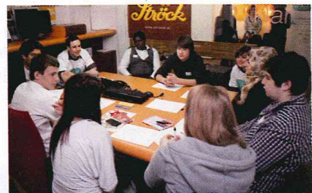
Vorbereitung in Workshops bei Cox Orange SchülerInnen der Polytechnischen Schule Pyrker gasse.